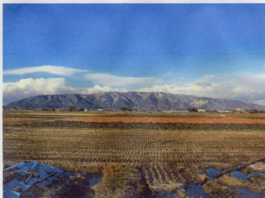
↑ 初日の出に輝く多度