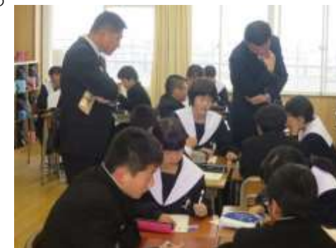
愛知県道德教育研究大会