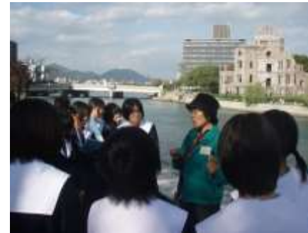
平和学習(広島研修)