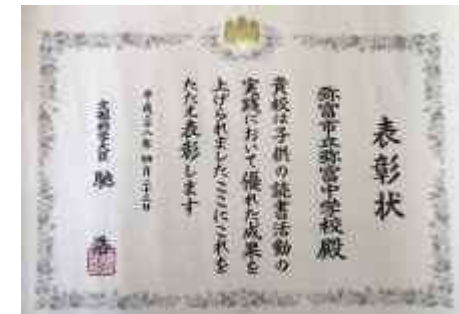
子どもの読書活動優良実践校表彰