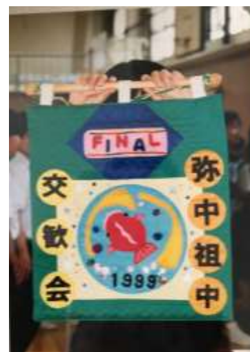
祖父江中交歓会終了