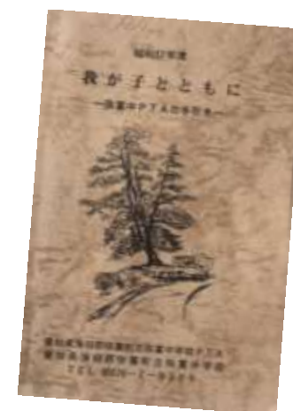
「我が子とともに」創刊